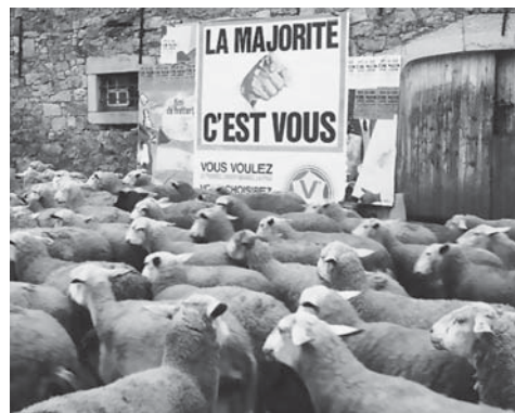
Надпись на плакате: «большинство — это вы».

Тоталитарное общество! — обрадовано воскликнут господа либералы.